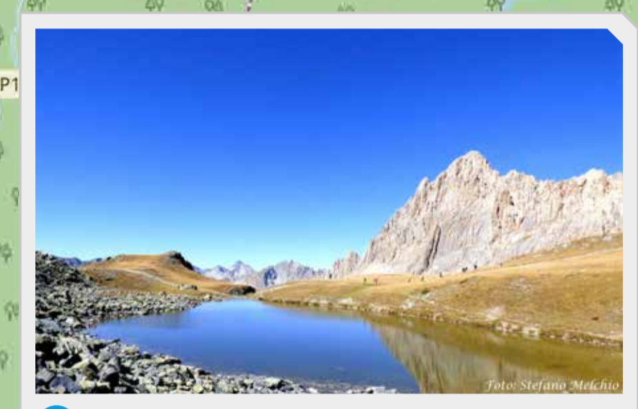
3 Lago e Rocca la Meja / Rocca la Meja and Lake