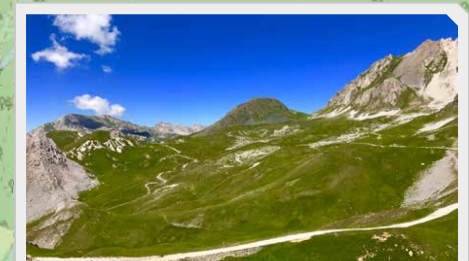
1 Dal colle Valcavera verso il Colle della Bandia, il Becco nero e il Colle d'Anocchia / From Colle Valcavera towards Colle della Bandia, Becco Nero and Colle d'Anocchia