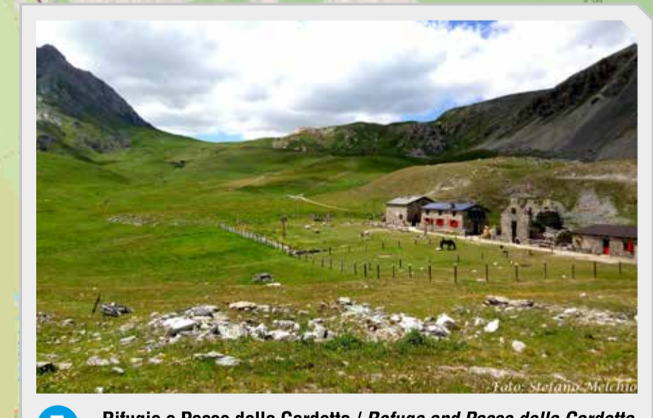
5 Rifugio e Passo della Gardetta / Refuge and Passo della Gardetta