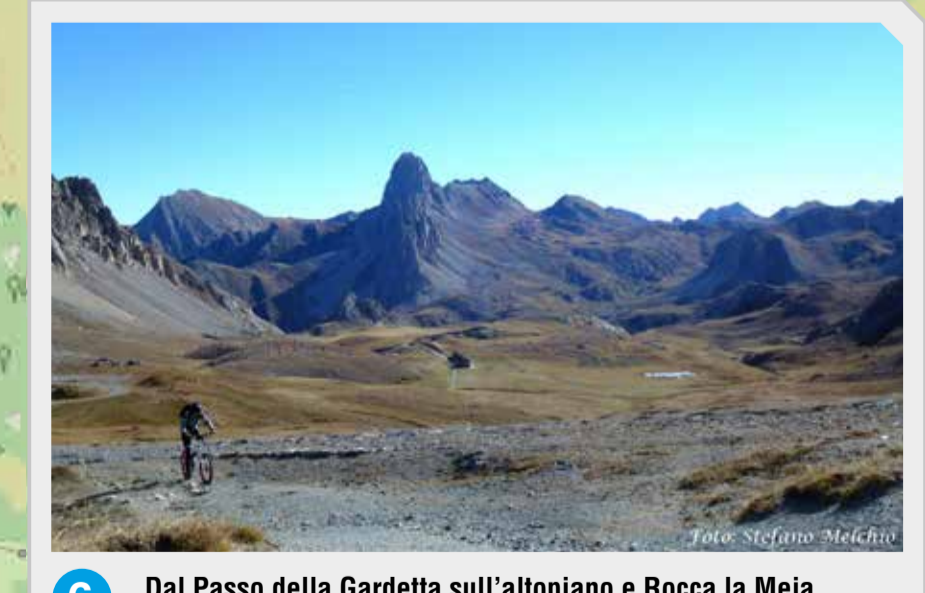
6 Dal Passo della Gardetta sull'altopiano e Rocca la Meja / From Passo della Gardetta on the plateau and Rocca la Meja